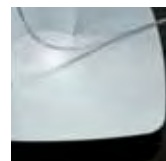
satin finished base