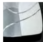
chrome plated base

Shakti is a floor lamp with two lights for reading and ambient that can be dimmed. The light diffuser is a laser cut extruded Plexiglas tube, fixed into a satin finished or chrome plated base. Thanks to the new technology of co-extrusion Shakti's light is always white, even in the coloured versions.