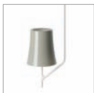
grigio / grey