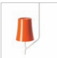
arancio / orange