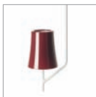
amaranto / amaranth