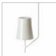
bianco / white